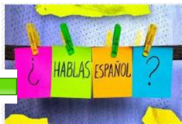
IMMERSION EN ESPAGNOL